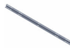
Płatew dla podpory L=X