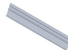
Wiatrownica Podpora południe L=X