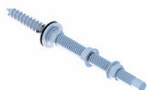
Śruba dwugwintowa M10 200/250/300