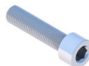
Śruba imbusowa M8X35 DIN912 A2