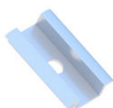
Klema środkowa 50 uniwersalna Natura/Czarna

KLK50/30(32/35/40)ALN KLK50/30(32/35/40)ALCZ