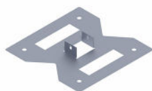
Podstawa zgrzewana dla podpory