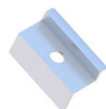
Klema końcowa 30/32/35/40 Natura/Czarna

KLK50/30(32/35/40)ALN KLK50/30(32/35/40)ALCZ