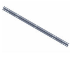
Płatek dla podpory L=2175/2380/2728