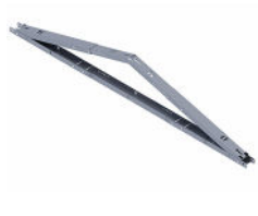
Trójkąt uniwersalny Wschód-zachód