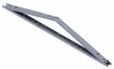
Trójkąt uniwersalny Wschód-zachód