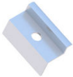
Klema końcowa 30/32/35/40 Natura/Czarna

KLK50/30(32/35/40)ALN KLK50/30(32/35/40)ALCZ