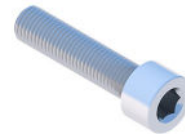
Śruba imbusowa M8X35 DIN912 A2