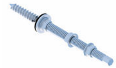
Śruba dwugwintowa M10 200/250/300